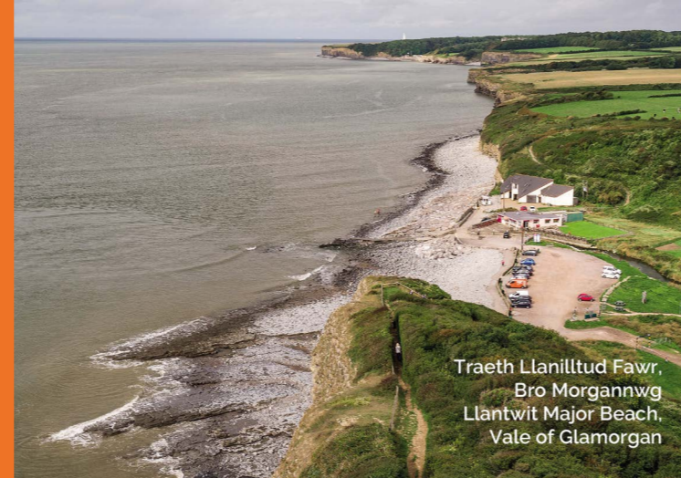
Traeth Llanilltud Fawr, Bro Morgannwg Llantwit Major Beach, Vale of Glamorgan