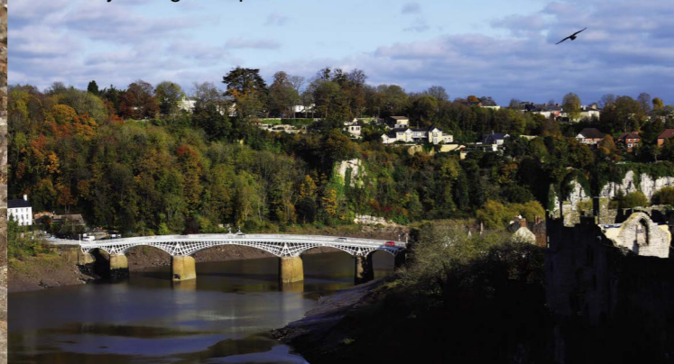
Hen Bont Gwy, Cas-gwent Old Wye Bridge, Chepstow