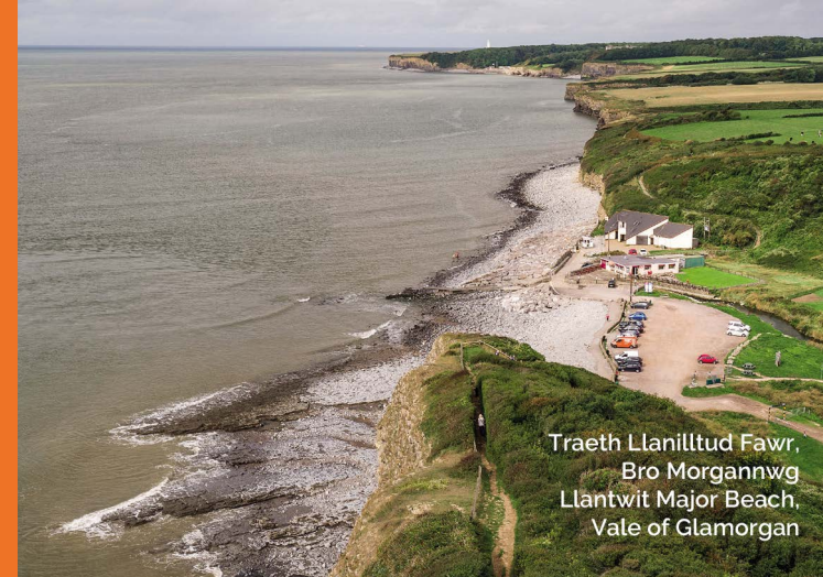
Traeth Llanilltud Fawr, Bro Morgannwg Llantwit Major Beach, Vale of Glamorgan