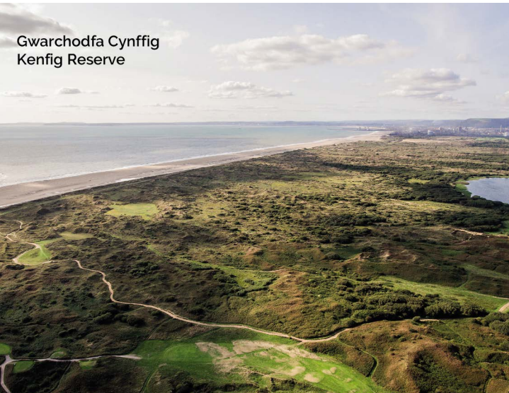
Gwarchodfa Cynffig Kenfig Reserve