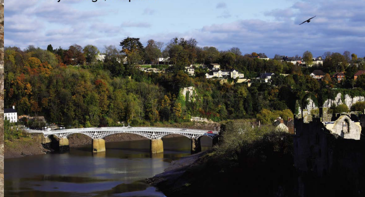
Hen Bont Gwy, Cas-gwent Old Wye Bridge, Chepstow